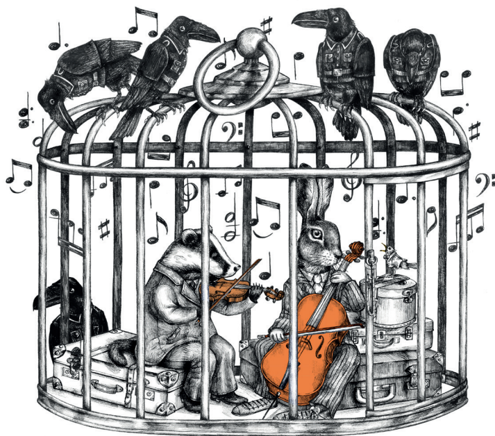
ILLUSTRATION FÖRSTA SIDAN Elin Andersson