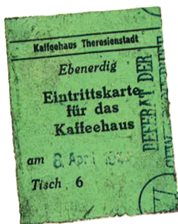
Terezins kafé och biljett till detsamma.