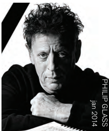
PHILIP GLASS Jan 2014