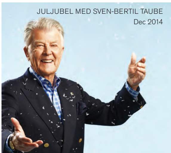
JULJUBEL MED SVEN-BERTIL TAUBE Dec 2014