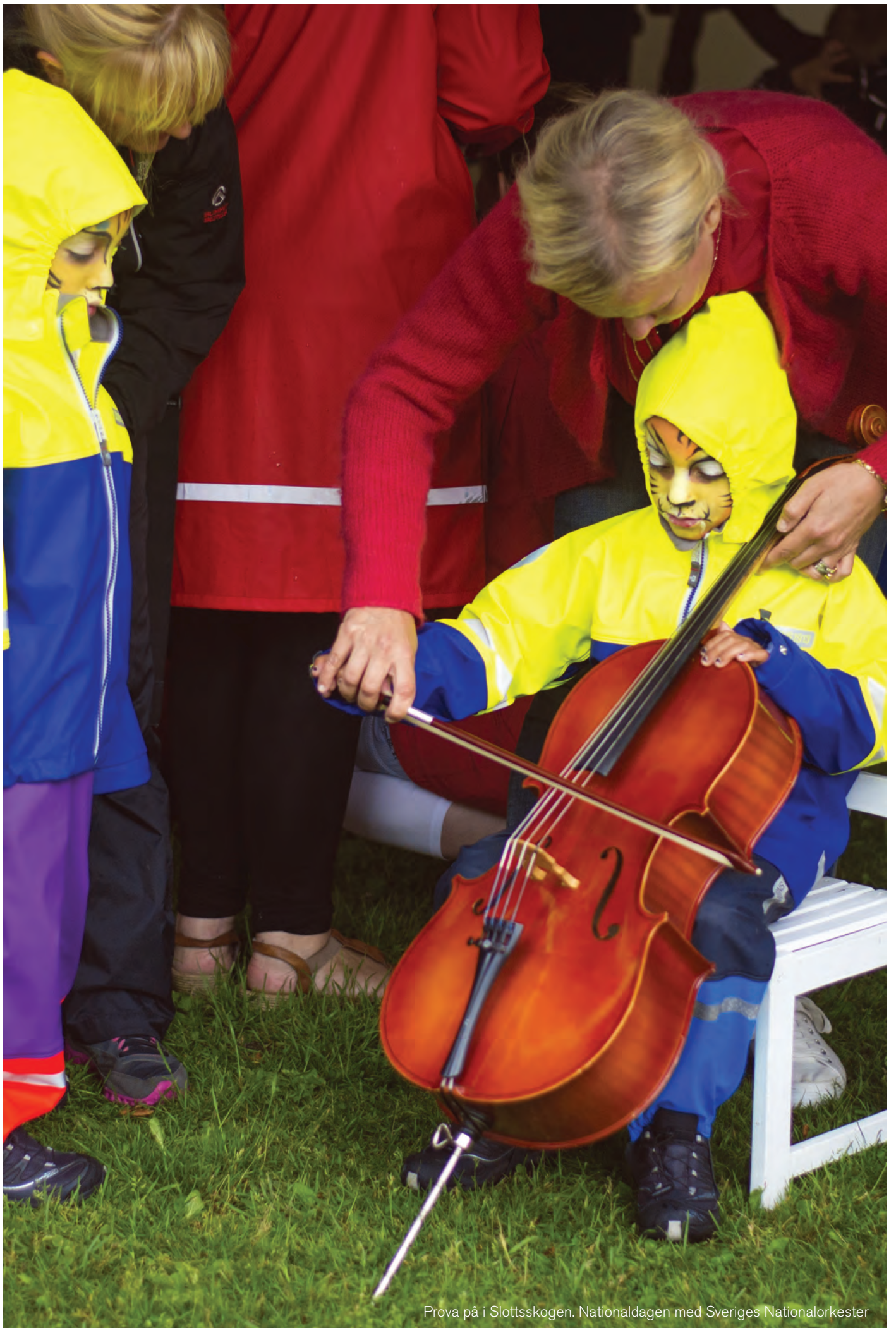
Prova på i Slottsskogen. Nationaldagen med Sveriges Nationalorkester