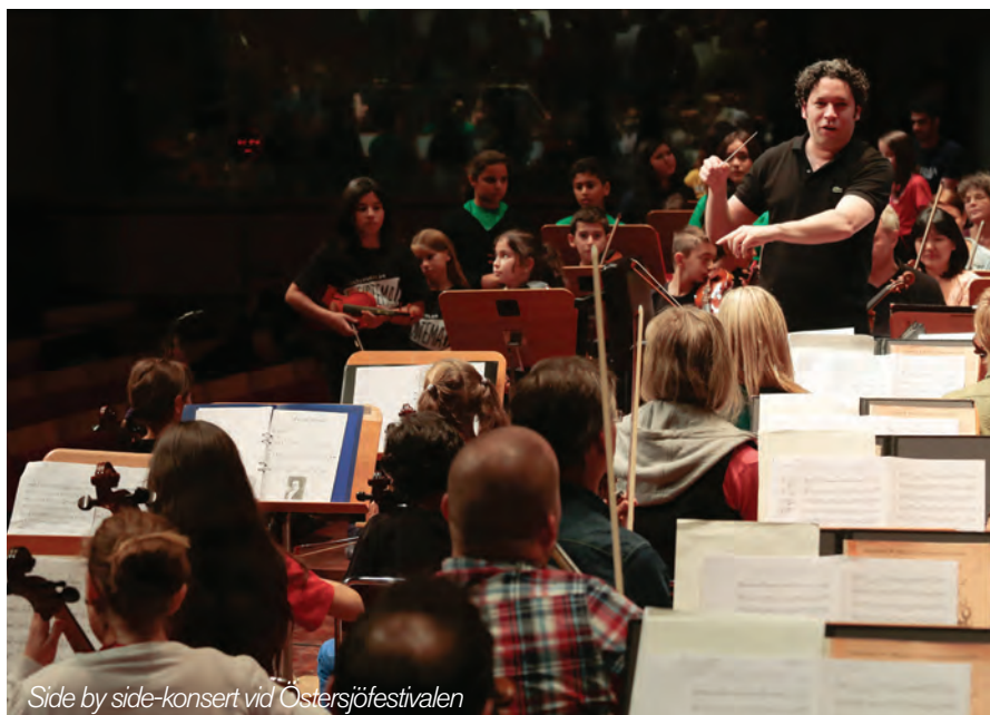
Side by side-konsert vid Östersjöfestivalen

På temat gästspel bjöds den lokala orkestern Vägus, Västra Götalands Ungdomssymfoniker in till Konserthuset och fick möjlighet att ge en konsert. I Vägus spelar 70 ungdomar i åldrarna 14-20 år. Polstjärnepriset är en tävling för unga musiker i regi av Vänersborgs kommun. Finalen gick för andra gången av stapeln i Göteborgs Konserthus i januari. Samarbetet med tävlingen är så framgångsrikt att vi nu tagit beslutet att involvera hela orkestern i projektet som kommer att ackompanjera nästa års finalister. Sportlovskorens samlade ett 50-tal ungdomar i åldrarna 14-19 år. I april bjöds 200 violinister från Göteborgs samtliga kulturskolor in för en speldag tillsammans med norska Alexander Rybak. Unga musikanter agerade förband till Göteborgs Symfoniker under nationaldagskonserten i Slottsskogen. I Höstlovskören deltog 75 sångare i åldrarna 14-24 år.