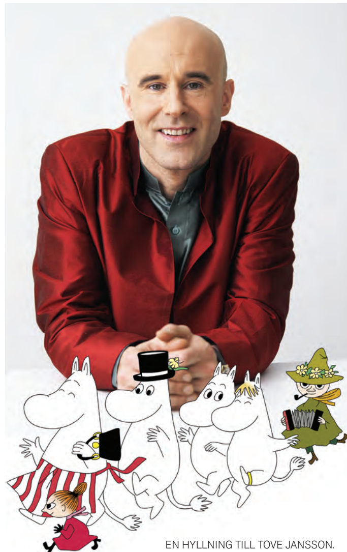
EN HYLLNING TILL TOVE JANSSON. Kulturkalaset Götaplatsen, aug 2014

Vid 20 tillfällen har skolklasser kommit till Konserthuset på studiebesök. Kreativa samspel, ett slags utökat studiebesök där barnen själva får skapa musik och röra sig till musik och på så sätt få ett nära möte med musiker ur Göteborgs Symfoniker, har anordnats vid tre tillfällen. Totalt 17 klasser deltog i dessa.