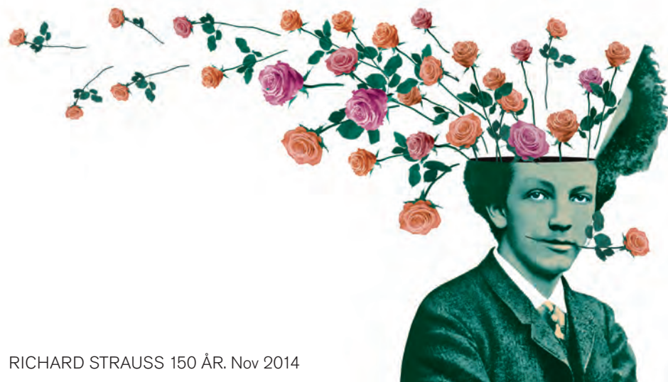
RICHARD STRAUSS 150 ÅR. Nov 2014