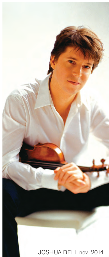
JOSHUA BELL nov 2014