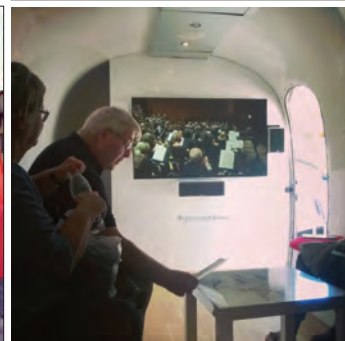
Kulturkalaset 2014. Folkhavet på Götaplatsen, Göteborgs Symfoniker med Laleh.